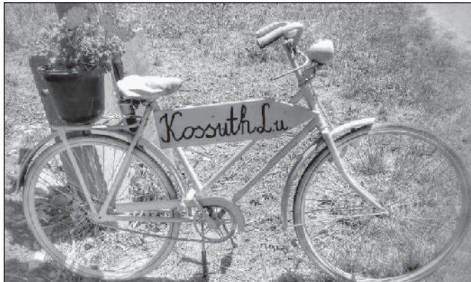
a nagyszerű ötletet és a csodás kivitelezést.